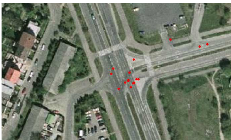
Výskyt dopravných nehôd od roku 2007