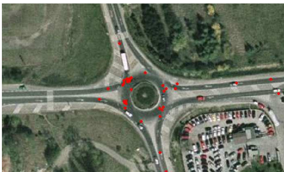
Výskyt dopravných nehôd od roku 2007